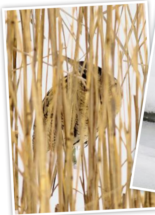
Camouflage dans la roselière.