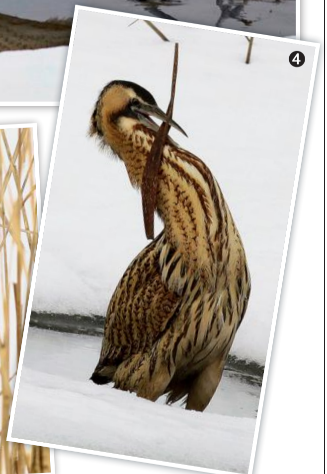
Une posture toute de discrétion.